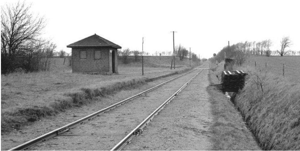
Donsborg trinbræt set mod Rødkærsbro