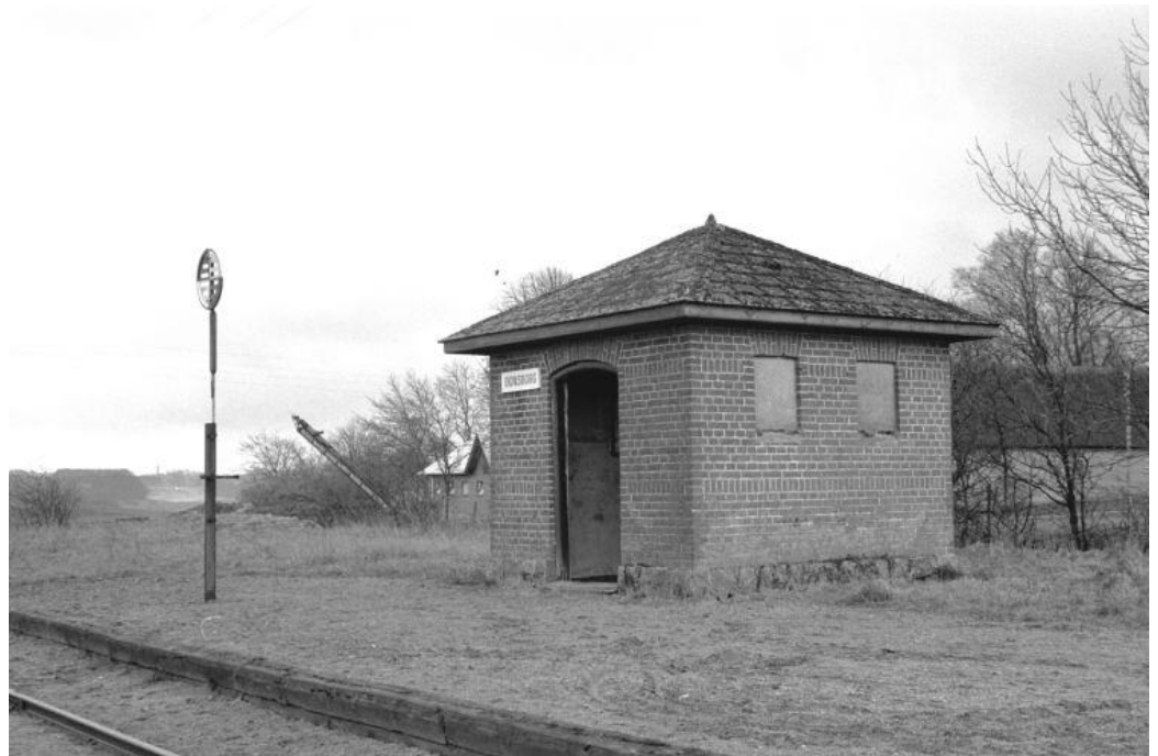
Trinbræt- bygningen set mod henholdsvis NV og SV (se side 1)