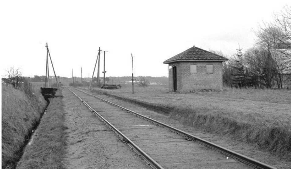
Trinbrættet set mod Silkeborg.