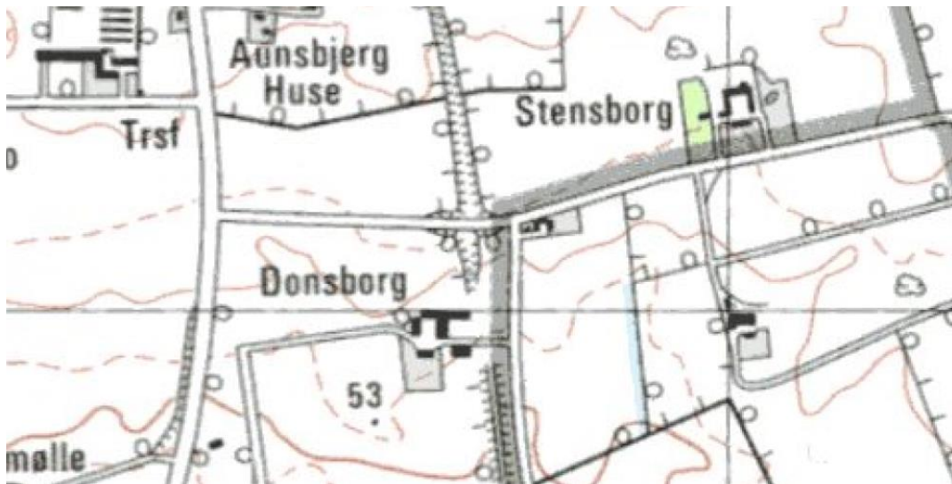
Donsborg Trinbræt