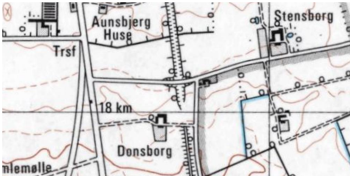
Donsborg Trinbræt