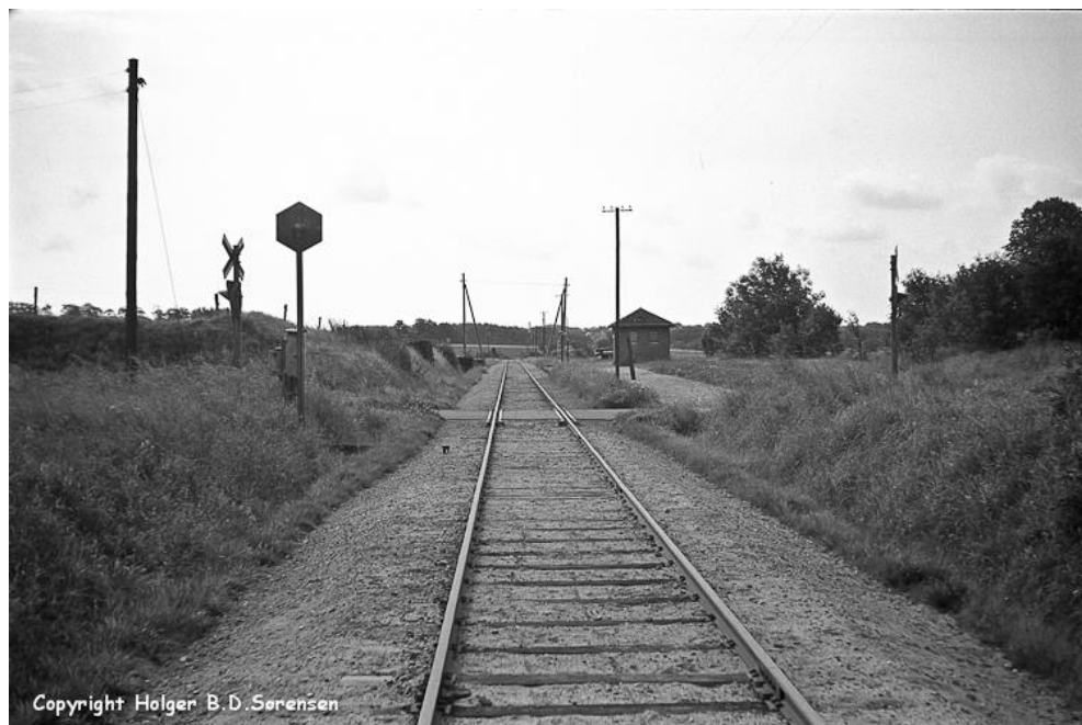
Donsborg Trinbræt Først set fra nord