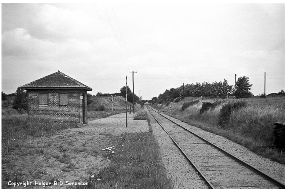
og modsatte retning