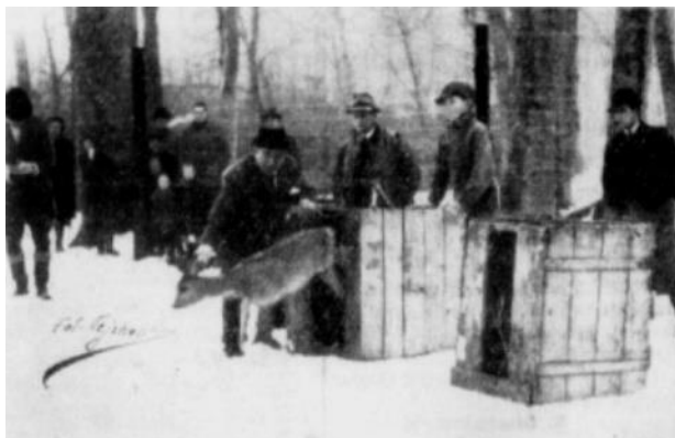
De første dådyr udsættes i 1941