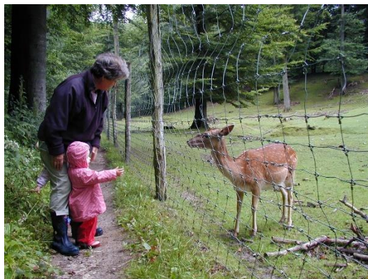
Då i dyrehaven i 2004